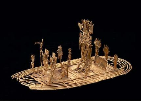
Balsa votiva muisca. 10.2 cm alto, 19.5 largo. Pasca, Cundinamarca.

“...En aquella laguna de Guatavita se hacía una gran balsa de juncos, y aderezábanla lo más vistoso que podían... A este tiempo estaba toda la laguna coronada de indios y encendida por toda la circunferencia, los indios e indias todos coronados de oro, plumas y chagualas... Desnudaban al heredero... y lo untaban con una liga pegajosa, y rociaban todo con oro en polvo, de manera que iba todo cubierto de ese metal.