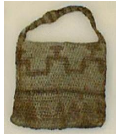
Mochila muisca. 19.5 x 14.5 cm