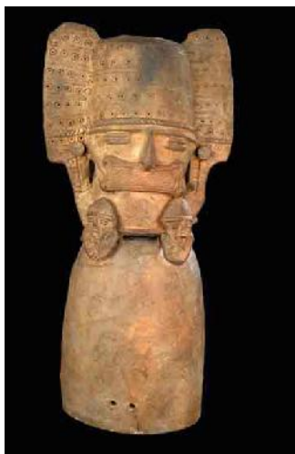
Ofrendatario muisca. 31 cm de alto.

Soy el gran jeque de Ubaque, todos los muisca de estos montes y valles reconocen mi poder y sabiduría. Todos se inclinan ante la diadema y las orejeras de orfebrería que identifican mi rango.