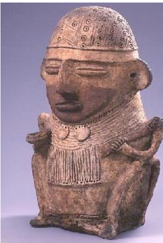
Ofrendario Muisca. 37 cm de alto

Los muisca descendemos de los pueblos de lenguas chibchas que llegaron hace siglos a los altiplanos de esta Cordillera Oriental.