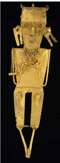
Tunjo muisca. 17.8 cm de alto. Gutiérrez, Cundinamarca.

¡Lléveme esta sal bien blanca, que traje de Zipaquirá y Nemocón, y este algodón fino, que viene de mano en mano desde el valle caliente del Chicamocha!