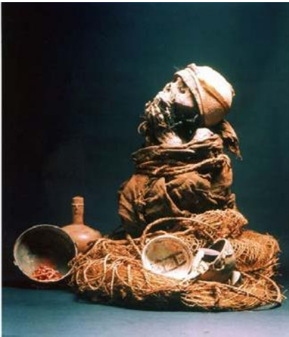
Momia muisca. 75 cm de alto. Pisba, Boyacá

Aquí donde me ven, en este museo, soy una verdadera momia muisca. Ya estoy cumpliendo 450 años, si contamos los treinta y nueve que tenía cuando morí.