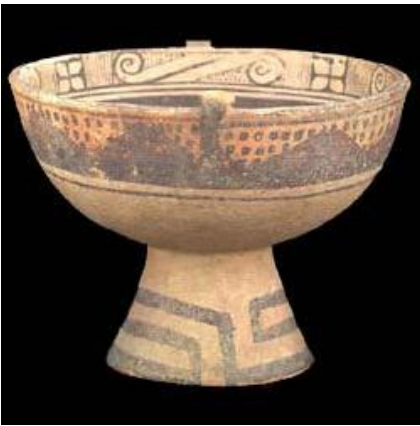
Copa ceremonial muisca. 13.5 cm alto.