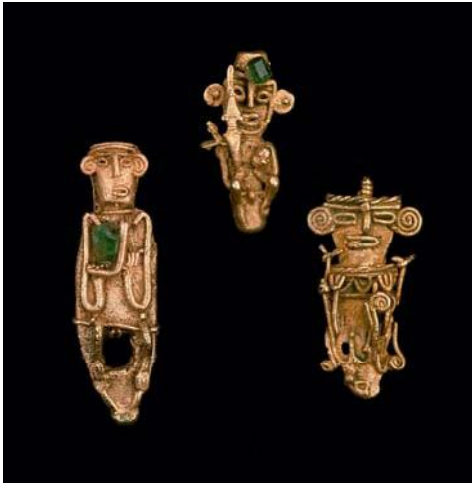
Tunjos muisca. 7 cm de alto el mayor. Pasca, Cundinamarca.

Mi trabajo es hacer bellas cosas de oro y cobre. Son cosas sagradas, y yo soy muy respetado por hacerlas.