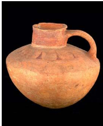
Jarra muisca. 17.5 cm de alto.