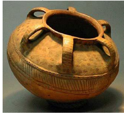
Olla muisca. 23.5 cm de alto.

En esta vereda somos olleros, esa es la tradición de por aquí, hacer ollas de barro. Cada semana en el día de mercado las llevamos a cambiar y trocar por sal y por algodón que traen los mercaderes de otras partes.